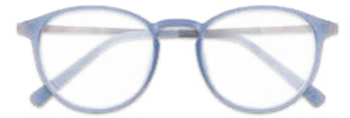
MORE & MORE

Kommen Sie einfach vorbei. Wir nehmen uns Zeit für Sie!